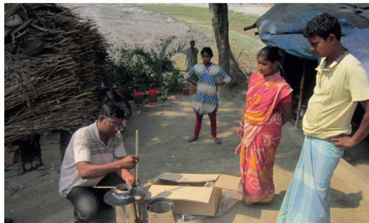
Vor Ort wird den Nutzern der Aufbau und die Funktionsweise der lokal produzierten Kochöfen genau erläutert. Alle Kochöfen sind mit dem Lions-Logo gekennzeichnet.

Damit sparen sie CO 2 -Emissionen ein, schützen den lokalen Baumbestand und die Gesundheit der Nutzer. Sie produzieren außerdem wertvolle Holzkohle. Auch bei der Verteilung der Öfen sind unsere lokalen Partnerorganisationen bestrebt, die CO 2 -Emissionen so gering wie möglich zu halten.