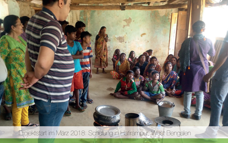
Projektstart im März 2018: Schulung in Hatirampur, West Bengal